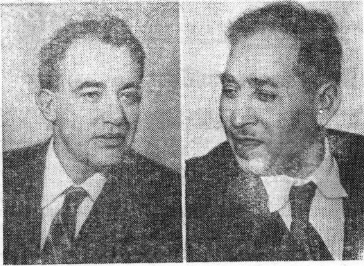
ЛАУРЕАТЫ МЕЖДУНАРОДНОЙ ЛЕНИНСКОЙ ПРЕМИИ „ЗА УКРЕПЛЕНИЕ МИРА МЕЖДУ НАРОДАМИ“. А. Е. Корнейчук — писатель, общественный деятель (СССР), Азиз Шериф — общественный деятель (Иранская Республика).