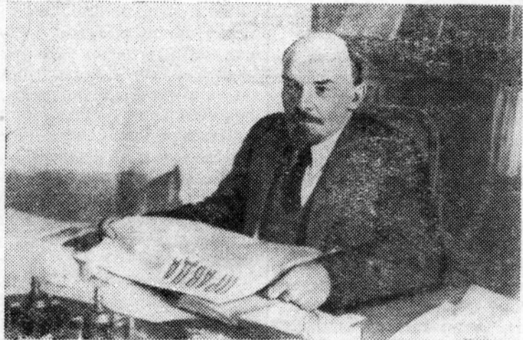
В. И. Ленин за чтением «Правды».

Сегодня — День советской печати. Рожденная творчеством народных масс, советская печать верно служит интересам трудящихся и является мощным средством их коммунистического воспитания.