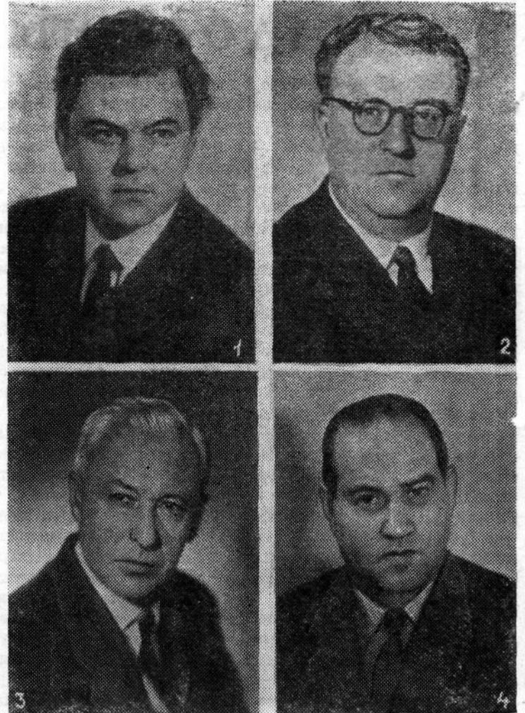
ЛАУРЕАТЫ ЛЕНИНСКИХ ПРЕМИИ 1960 ГОДА В ОБЛАСТИ ИСКУССТВА:

Стадиону «Труд» ТРЕБУЮТСЯ СТОРОЖА. Обращаться к директору стадиона тов. Сабодкому.