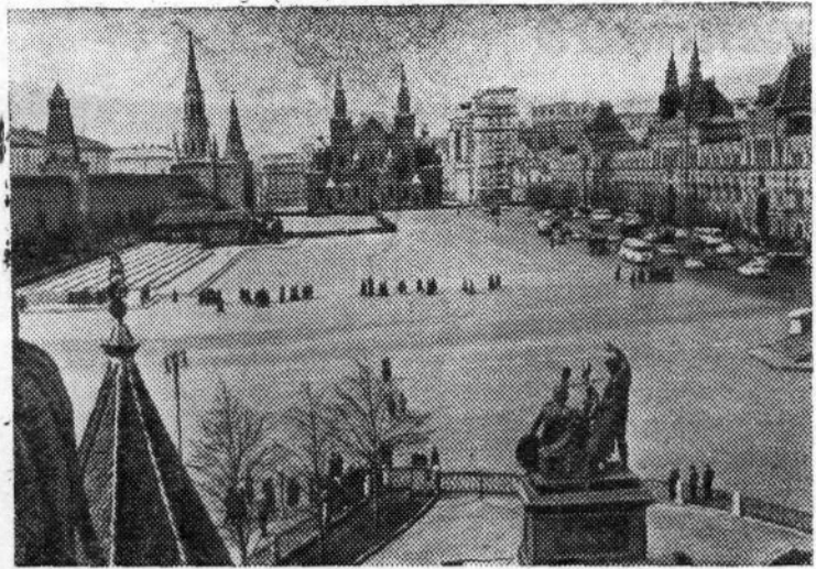
МОСКВА. КРАСНАЯ ПЛОЩАДЬ.