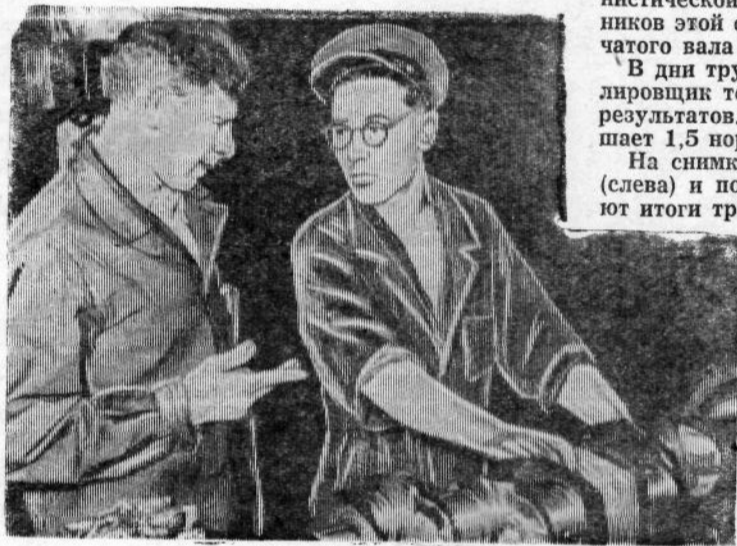
Слава передовикам и новаторам производства, ударникам и коллективам коммунистического труда, идущим в первых рядах строителей коммунизма! (Из Призывов ЦК КПСС к 1 Мая 1960 года).

На базе газотурбинного двигателя со временем на нашем заводе будут выпускаться транспортные тракторы. Один из них — колесный тягач высокой проходимости.