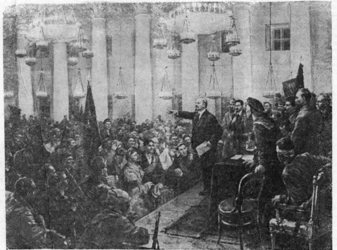
«Выступление В. И. Ленина на II Всероссийском съезде Советов».