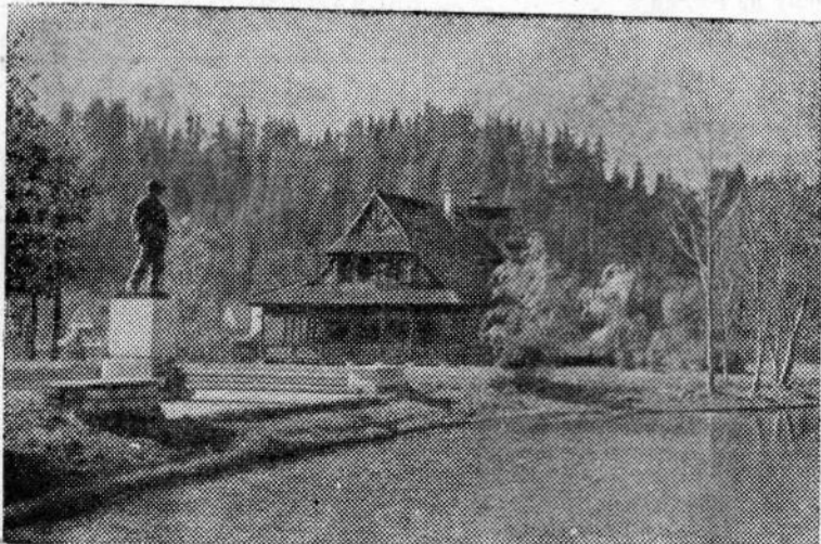
ПОЛЬСКАЯ НАРОДНАЯ РЕСПУБЛИКА. Музей В. И. Ленина в селе Поронинно (близ Кракова).

На снимке: памятник В. И. Ленину и дом, в котором 27 июля (9 августа) 1913 года под руководством В. И. Ленина состоялось совещание членов ЦК РСДРП.