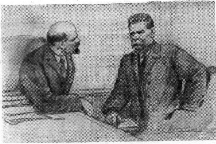
В. И. Ленин и А. М. Горький. Рисунок художника П. Васильева.