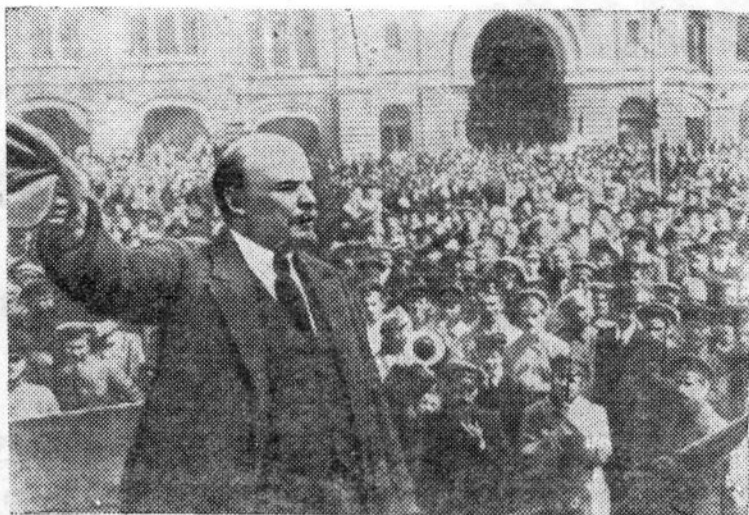
В. И. Ленин произносит речь на Красной площади в Москве. Май 1919 г.

Владимир Ильич жил и работал в Кремле с марта 1918 года по май 1923 года.