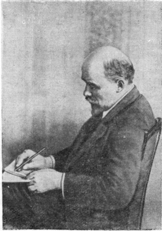
В. И. Ленин на конгрессе Коминтерна.