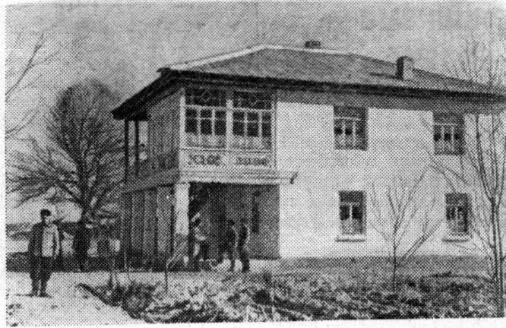
Узбекская ССР. За последние годы в колхозе имени Карла Маркса Шахрисабзского района Сурхан-Дарьинской области построено много жилых домов, две средние и начальная школы, медицинский пункт, столовая, магазин, гостиница и другие культурно-бытовые учреждения.

Подсчитано, что использование отходов других поковок обеспечивает цеху условно-годовую экономию, равную 7 585 рублям.