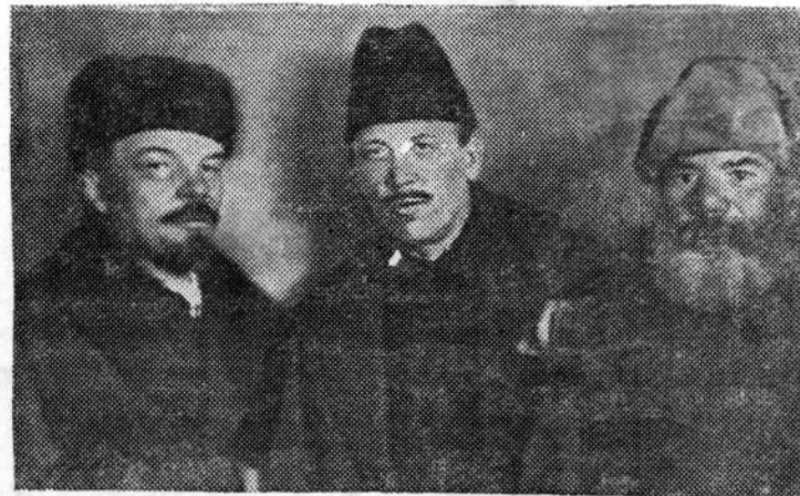
В. И. Ленин, Д. Бедный и делегат от Украины Ф. Панфилов на VIII съезде РКП(б). Март 1919 года.