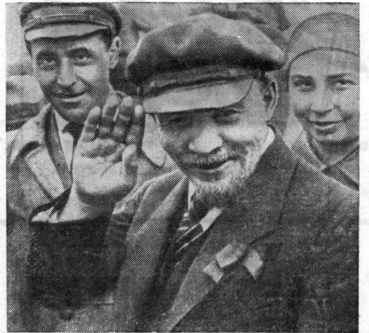
В. И. Ленин на закладке памятника «Освобожденный труд». Москва, 1 мая 1920 года (кинокадр).