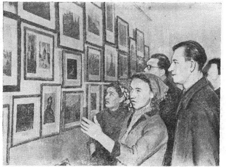
Сумская область. Коллектив Сумского государственного художественного музея проявил ценную инициативу, организовав передвижную выставку репродукций картин Третьяковской галереи. Она уже побывала во многих колхозных и рабочих клубах, школах.

В книге изложены общие понятия о чертежах и схемах, которыми пользуются при монтаже и эксплуатации электрических устройств. Основное назначение книги — помочь начинающим электротехникам читать чертежи и схемы электроустановок.