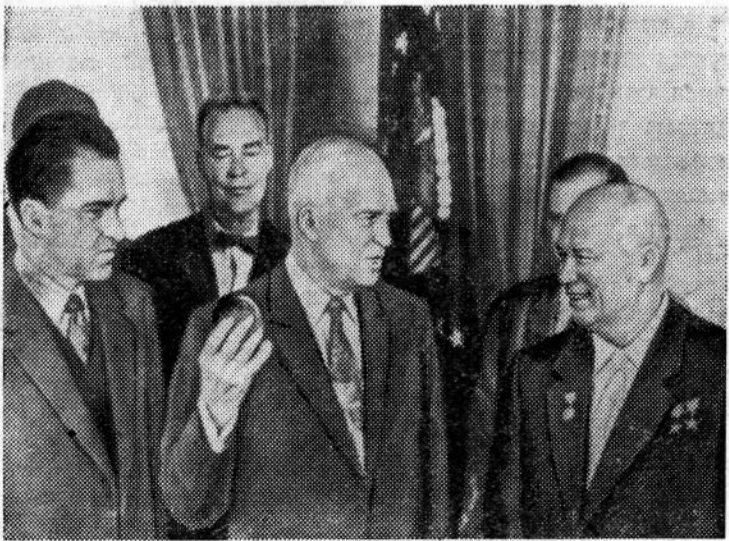
Вашингтон. Беседа в Белом доме между Председателем Совета Министров СССР Н. С. Хрущевым и президентом США Д. Эйзенхауэром.

Н. С. Хрущев отметил, что, по мнению Советского Союза, в ООН должна проводиться самая разумная и дальновидная политика — политика совместных поисков взаимно приемлемых решений и что настала пора открыть полосу международных переговоров, совещаний и встреч государственных деятелей с тем, чтобы один за другим находили свое решение назревшие международные вопросы,