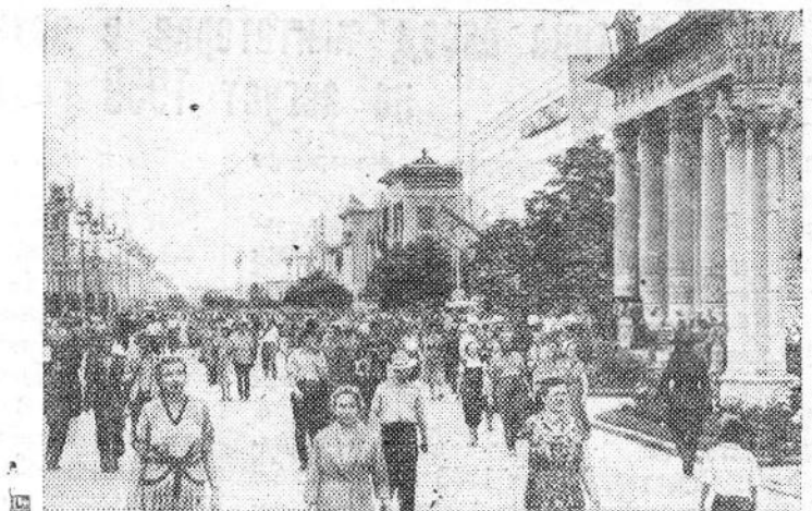
Тысячи москвичей, экскурсантов из различных районов страны и зарубежных гостей ежедневно посещают Выставку достижений народного хозяйства СССР. На снимке: на территории выставки.