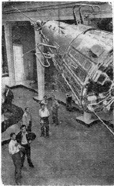
Москва. На Выставке достижений народного хозяйства СССР. В одном из залов павильона Академии наук СССР. Модель третьего советского искусственного спутника Земли в натуральную величину.