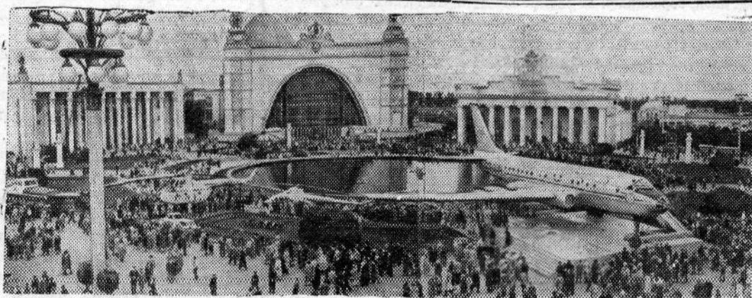
Москва. Выставка достижений народного хозяйства СССР.