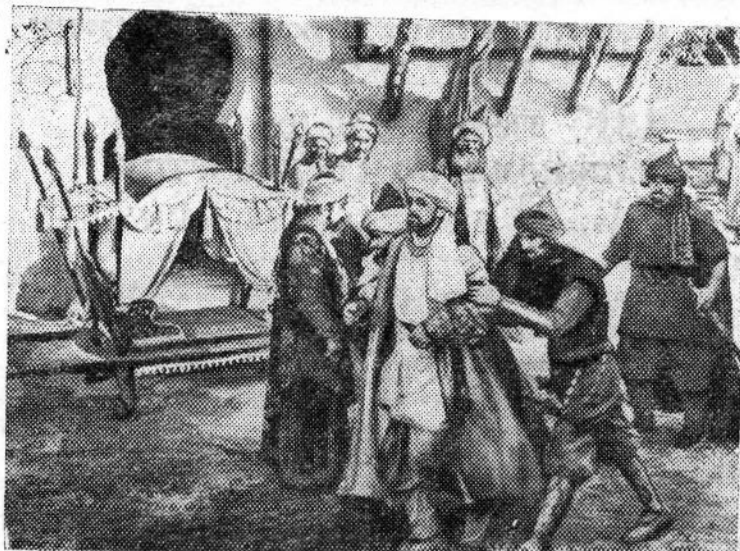
Таджикская ССР. Сталинабадская киностудия «Таджикфильм» увеличивает выпуск художественных фильмов. В ближайшее время будут выпущены на экраны кинофильмы «Судьба поэта» и «Человек меняет кожу» (первая серия).

На конференции избран заводской совет ВОИР.