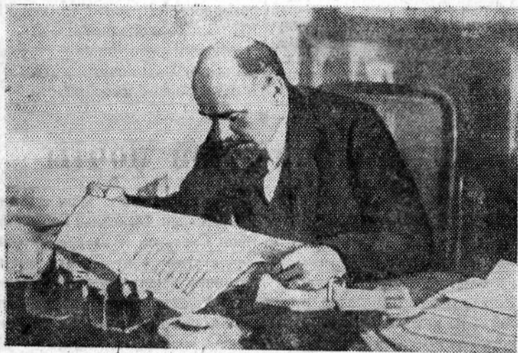
В. И. Ленин за чтением «Правды».