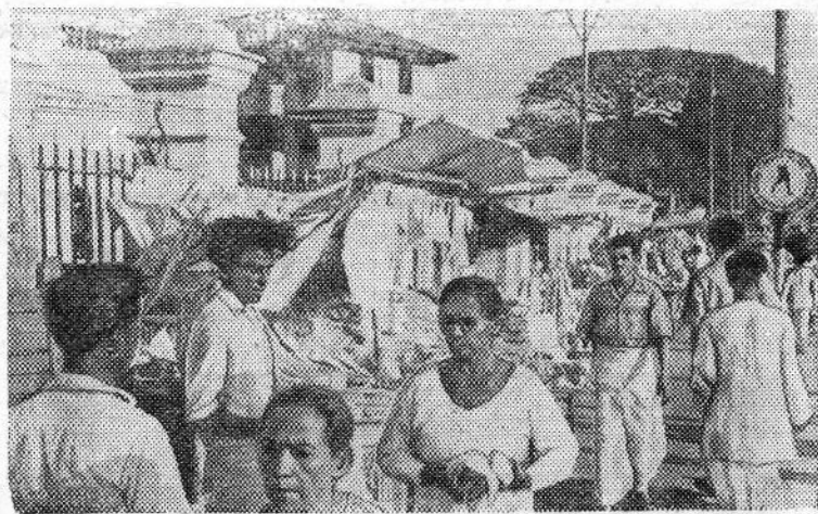
На улице в одном из наиболее густо населенных районов столицы Цейлона—Коломбо.

Выступивший перед делегатами съезда член Политбюро ЦК и секретарь ЦК Французской коммунистической партии Жак Дюло отметил активную деятельность членов союза в политической борьбе французских студентов и призвал их еще больше укреплять единство молодежи.