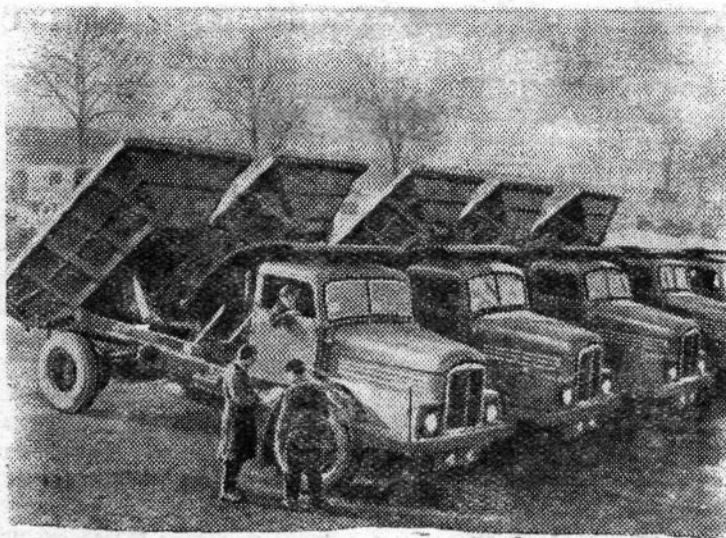
Германская Демократическая Республика. На Лейпцигской международной весенней ярмарке народное предприятие «Специальфарцейгверк» в Берлине представило наряду с другими экспонатами самосвалы с обогреваемым снизу кузовом, предназначенные для транспортировки грузов в зимнее время. Полезная грузоподъемность машины—7 тонн.