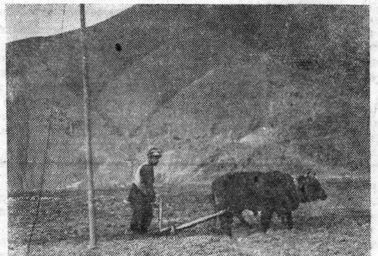
Афганистан. Землепашец в долине реки Гурбенд.

В Алжире не прекращаются ожесточенные бои между национально-освободительной армией и французскими войсками. О размахе военных действий свидетельствует, в частности, официальное комюнике французского командования, в котором говорится, что в период с 1 января по 12 февраля в результате боев было убито 2500 алжирцев. О потерях французской стороны не сообщается.