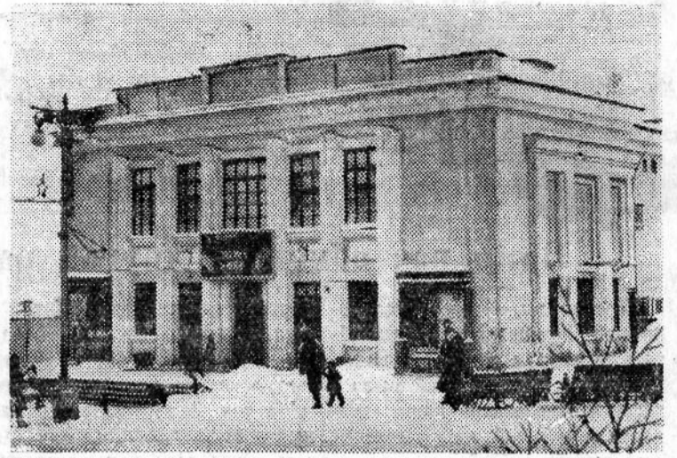
В Магадане открыт первый на Дальнем Севере широкоэкранный кинотеатр «Горняк». Его зал рассчитан на 600 человек и хорошо оформлен. Театр пользуется большой популярностью у трудящихся.

На снимке: широкоэкранный кинотеатр «Горняк».