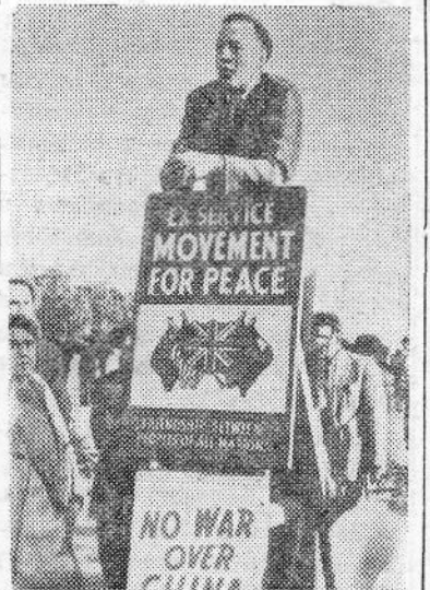
Англия. Недавно в лондонском Гайд-парке состоялся митинг жителей столицы, проходивший под лозунгом «Руки прочь от Китая!»

долларов расходуется ежегодно для засылки в эти страны шпионов и диверсантов, для ведения в социалистических государствах враждебной пропаганды, для сбора разведывательных сведений. В этих целях американские военные органы широко используют воздушные шары со специальной аппаратурой.