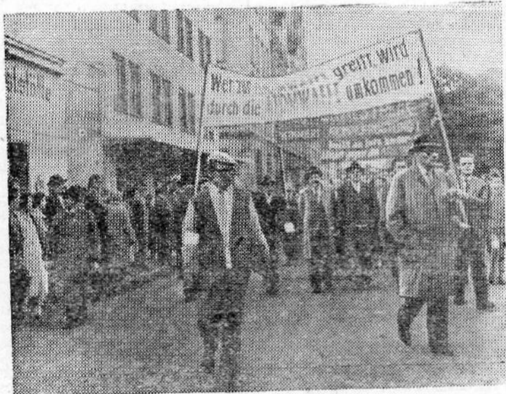
Федеративная Республика Германии. В Мюнхене состоялся митинг протеста против оснащения бундесвера атомным оружием.

На снимке: трудящиеся направляются на митинг протеста. Транспарант гласит: «Кто прибегнет к атомному оружию, тот от него и погибнет!»