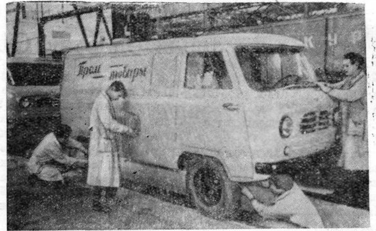
На Ульяновском автомобильном заводе начат серийный выпуск автомобилей УАЗ-450. Десятки таких машин уже отправлены потребителям.

На снимке: сборка автомобилей УАЗ-450.