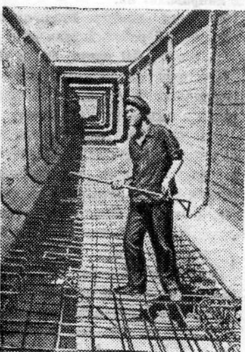
Сталинская область. Строительство канала Северный Донец—Донбасс решили закончить все работы на трассе на год раньше срока—к 41-й годовщине Великого Октября.

На совещании пяти активистам были вручены подарки.