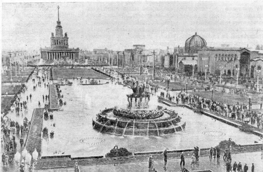
Москва. Всесоюзная сельскохозяйственная выставка 1958 года. На снимке: на площади Колхозов.