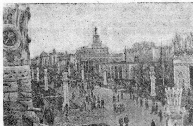
Москва. Всесоюзная сельскохозяйственная выставка в 1958 году. На снимке: на территории выставки,

Государства, представленные на Совещании, заявляют, что они приложат все свои усилия, чтобы неослабно защищать дело мира и бороться за предотвращение новой войны. Европа должна перестать быть полем сражений. Она может и должна стать зоной мира, спокойствия и безопасности. Война не является неизбежной, войны можно не допустить. Объединенными усилиями народов мир можно защитить и упрочить.