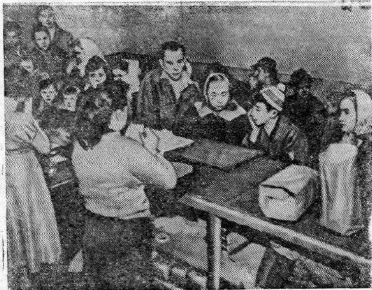
К экономическому положению в Соединенных Штатах Америки. Штат Мэн. Бидефорд. Очередь нуждающихся на пункте, где выдают продукты.