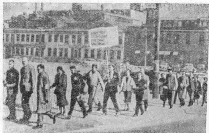
Соединенные Штаты Америки. Участники движения «Поход за мир», протестующие против испытаний атомного оружия, совершили шестидневный поход из Нью-Хейвена в Нью-Йорк к зданию ООН. По пути число участников похода непрерывно росло.

На снимке: первая колонна в Нью-Хейвене.