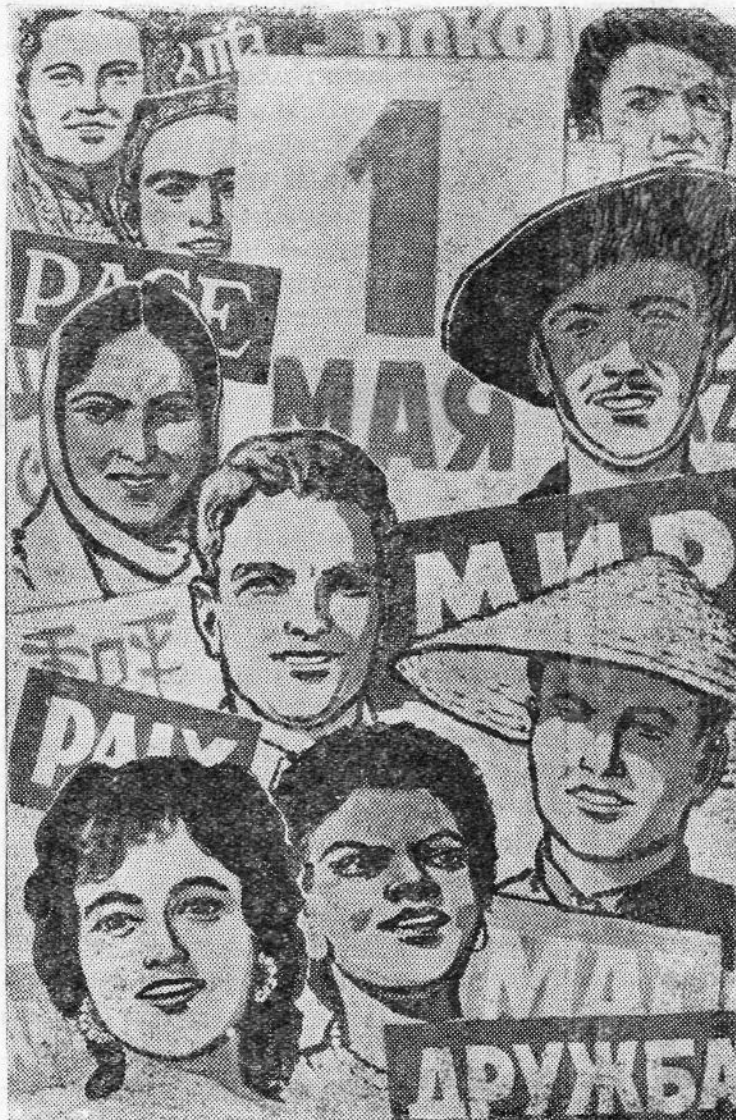
Плакат работы художника А. Кокорекина. (Государственное издательство изобразительного искусства).

Да здравствует коммунизм—светлое будущее всего человечества!