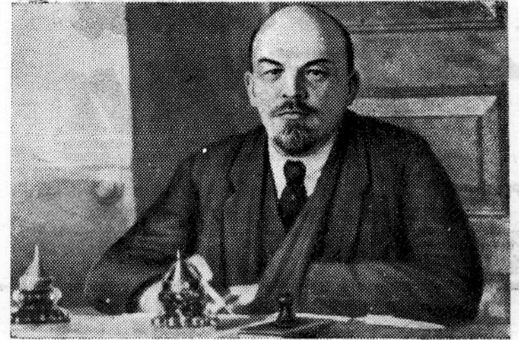
В. И. Ленин на первом заседании после ранения. 1918 год.