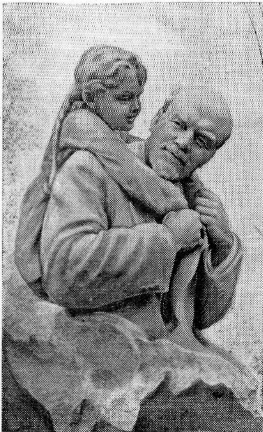
Скульптура З. И. Азгура «В. И. Ленин».