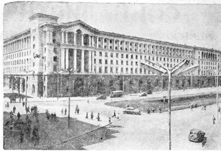
Народная Республика Болгария. Здание министерства электрификации в Софии.