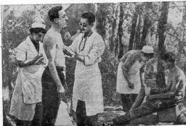
На снимке: в полевом госпитале национально-освободительной армии Алжира.