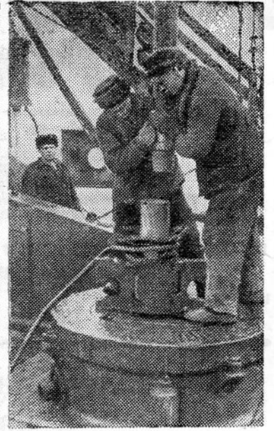
Киргизская ССР. Директивы XX съезда КПСС по шестому пятилетнему плану предусматривают увеличение добычи нефти в республике в 7,8 раза.