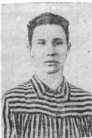
звание «Лучший рабочий своей профессии».

...Никогда не забудет она июльский день 1943 года, когда робкой женщиной, не знающей