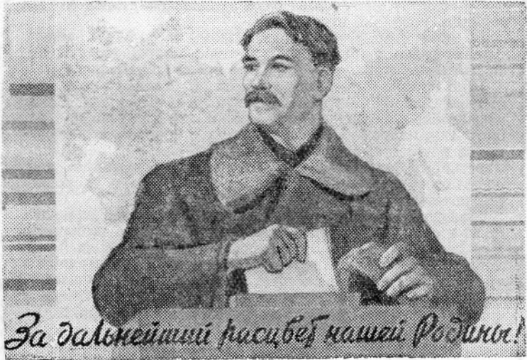
За дальнейший расцвет нашей Родины!

16-й год издания | № 31 (1863) | Суббота, 15 марта 1958 г. | Цена 10 коп.