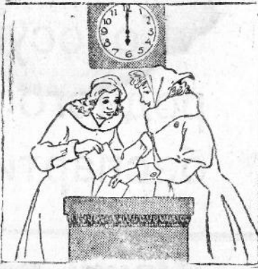
Впервые и впервые. Рис. Б. Елисева.