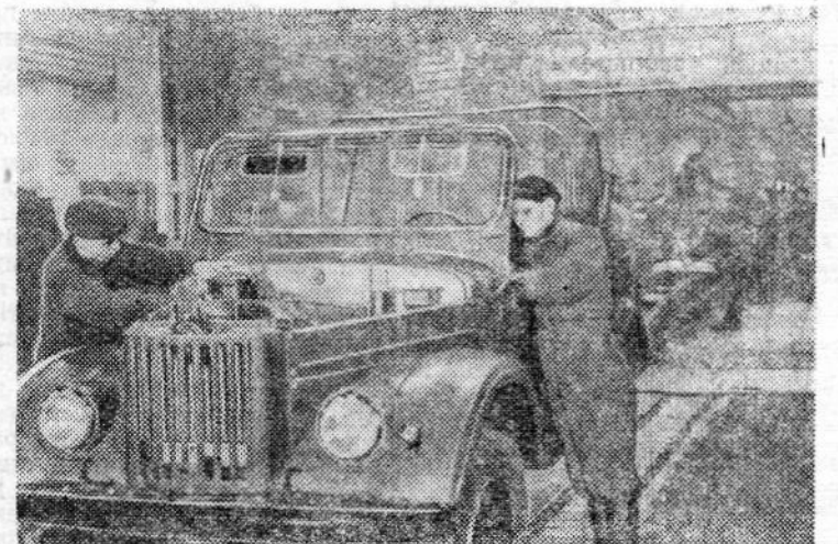
Ульяновские автомобилестроители решили достойно встретить выборы в Верховный Совет СССР. Они обязались дать по дню выборов 50 автомашин сверх плана. Коллективы всех цехов и участков настойчиво борются за выполнение этого обязательства. На снимке: сборка очередной партии автомобилей ГАЗ-69 на главном конвейере Ульяновского автозавода.