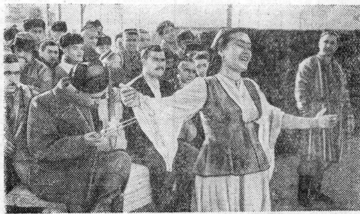
Таджикская ССР. Частыми гостями у колхозников Науского района Ленинабадской области бывают работники районного отдела культуры. На самых отдаленных полевых станах они выступают с концертами, читают лекции, демонстрируют кинофильмы.

На снимке: концерт на полевом стане колхоза имени Саттарова.