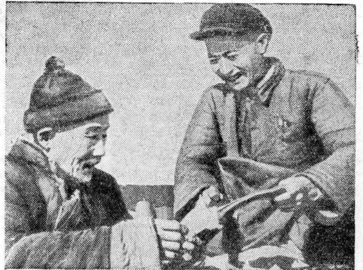
В китайской деревне повышается жизненный уровень крестьянства. Ярким показателем этого является рост вкладов в кредитных кооперативах и сельских банках. По сведениям народного банка Китая, общая сумма вкладов крестьян в сельских банках и кредитных кооперативах достигает 1.200 миллионов юаней.