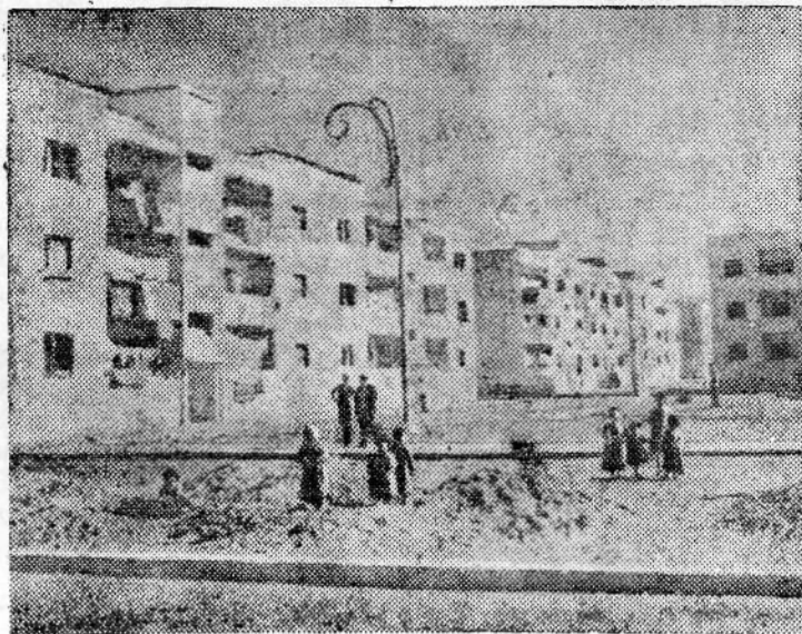
Республика Египет. В Порт-Саïде продолжают восстановительные работы. Больше года назад египетский народ дал отпор империалистической агрессии и добился вывода англо-французских войск из Порт-Саïда. Агрессоры сильно разрушили город. Сейчас на месте развалин возведены многоквартирные жилые корпуса.

картина жизни трудящихся Узбекистана в конце 20-х гг., передана сложная, напряженная обстановка первых лет индустриализации страны. Автор рассказывает о сооружении большого оросительного канала в Голодной степи.