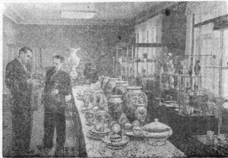
Киев. На Всемирной выставке в Брюсселе, которая откроется в 1958 году, будут представлены образцы изделий, изготовленных мастерами фарфоровых заводов Украины. Часть экспонатов уже отобрана и отправлена в Бельгию.