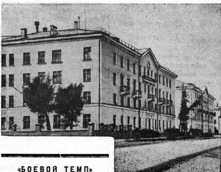
«БОЕВОЙ ТЕМП» 2 стр. 7 ноября 1957 г.

★ На Восточном поселенческом заводе выросли новые красивые здания. На них снимках: слева — новые жилые дома по улице Стяга, справа — здание гостины нашего завода на площади имени Ленина.