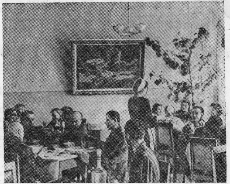
В столовой ночного санатория завода.

Долго веселись, пели, плясали дети, рассказывали стихотворения. Шефы преподнесли ребятам ценные подарки.