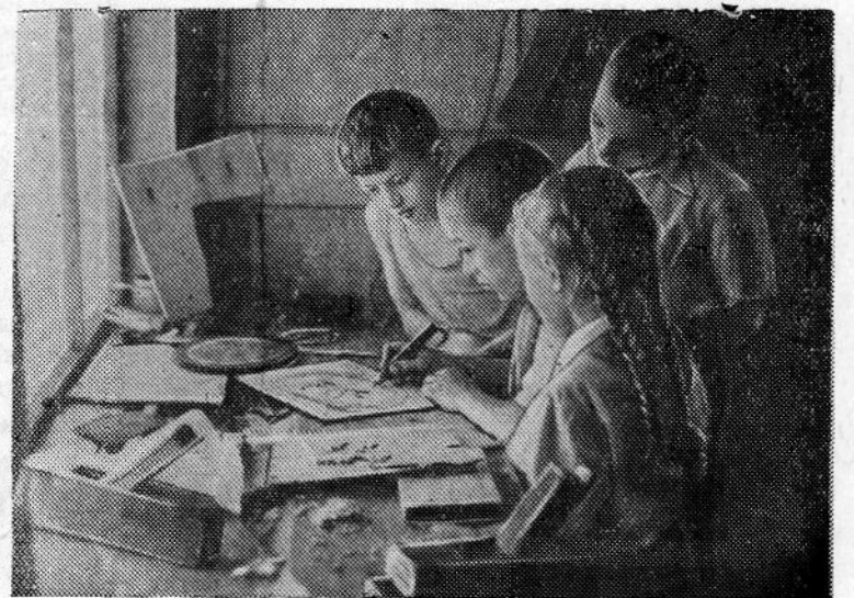
Занятия в кружке «Умелые руки»

ного труда. Здесь каждый нашел себе занятие по душе. Те пионеры, которые увлекаются спортом, под руководством физру-