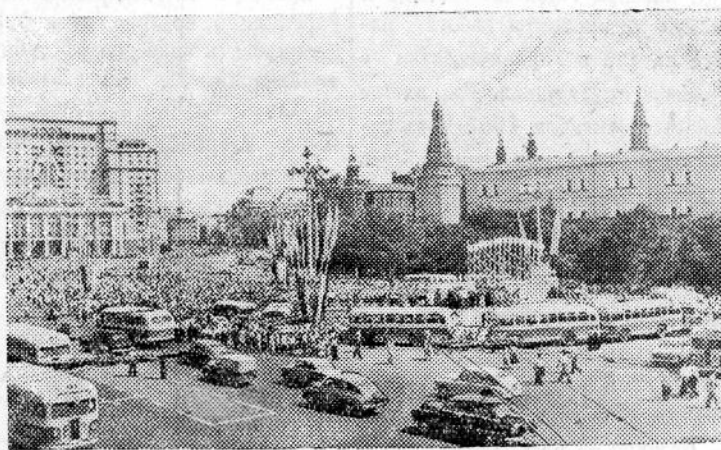
Москва. На Манежной площади в дни фестиваля.