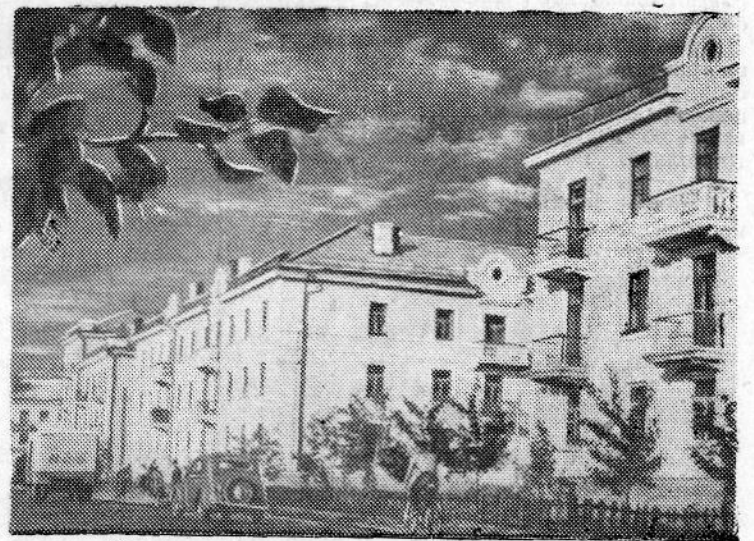
Новые дома на Восточном поселке завода