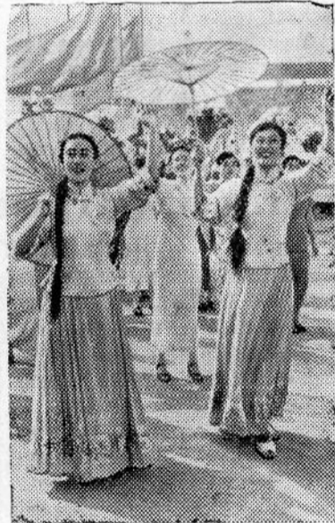
Москва, 28 июля. Торжественное открытие фестиваля на Центральном стадионе имени В. И. Ленина. На снимке: китайские девушки на стадионе. Фотохроника ТАСС.

Радиорупоры доносят сообщение о финише Международной эстафеты дружбы. Эстафета двинулась в Москву по нескольким маршрутам, пересекла двадцать стран. Десятки тысяч километров проделали участники эстафеты. На границе