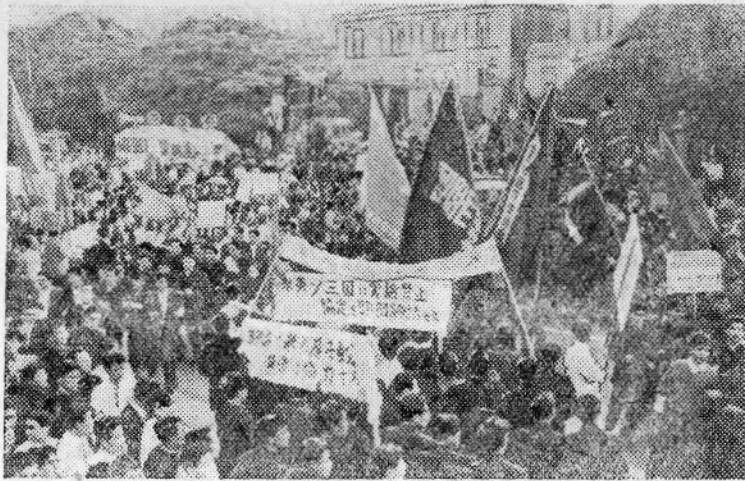
Япония. Испытание Англией водородного оружия в районе острова Рождества в Тихом океане вызвало возмущение японского народа.

Всеяпонская федерация органов студенческого самоуправления в сотрудничестве с японским комитетом борьбы против атомного и водородного оружия, Генеральным советом профсоюзов Японии и профсоюзом учителей Японии организовала ряд митингов в знак протеста против экспериментальных ядерных взрывов. В митингах приняли участие учащиеся 168 колледжей и университетов страны. Это явилось одной из крупнейших демонстраций японских студентов после 1952 года.