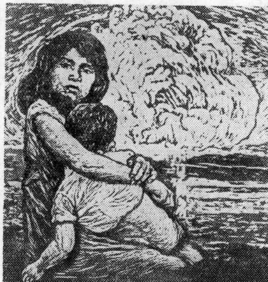
Эта гравюра известна всему миру.

«Ужасы Хиросимы не должны повториться!» — с этими словами обращается молодая мать. Международная демократическая федерация женщин, рассылая эту фотографию, сопровождает ее выдержкой из обращения Бюро Международной демократической федерации женщин.