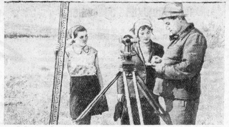
Казахская ССР. На Путьше, в 70 километрах выше Семипалатинска, находится комплексная экспедиция, ведущая разведочные работы на месте предстоящего строительства Шульбинской ГЭС. В составе экспедиции — большой отряд топографов.