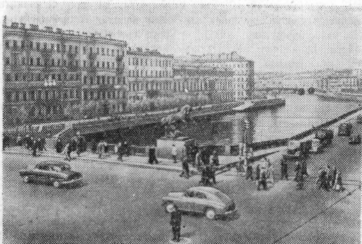
На снимке: вид на реку Фонтанку у Аничкова моста.