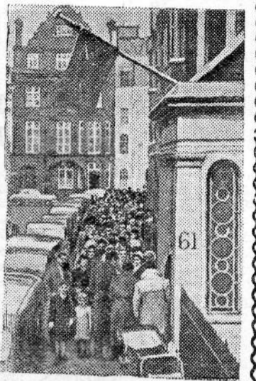
бежной печати, если в предыдущие годы из Англии ежегодно эмигрировало 125 тысяч британцев, то в текущем году их будет вдвое, а то и втрое больше.

Провал англо-франко-израильской авантюры в Египте привел английскую экономику, и без того испытывавшую большие трудности, к еще более напряженному состоянию. Все тяжелые последствия агрессивной политики правящих кругов Англии легли на плечи трудящихся. Материальное положение рядового англичанина ухудшается, растет неуверенность людей в завтрашнем дне. Около представителей стран, входящих в Британское содружество наций, в Лондоне и других городах Англии ежедневно выстраиваются сотни рабочих, техников и представителей других профессий, желающих иммигрировать в эти страны. По сообщениям иностранной печати, в течение 1956 года канадские регистрационные власти зарегистрировали 45 тысяч беженцев из Англии, 60 тысяч англичан выехало в этом же году в Австралию. Значительное количество заявок на въезд получено Новой Зеландией и другими странами. По оценкам зару-