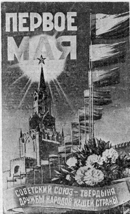
Плакат работы художника В. Викторова.

С праздником Первомай, дорогие товарищи!