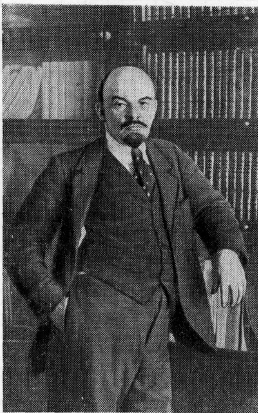
В. И. ЛЕНИН (1918 г.).

Вокзальная площадь была слабо освещена. Бросалось в глаза то,