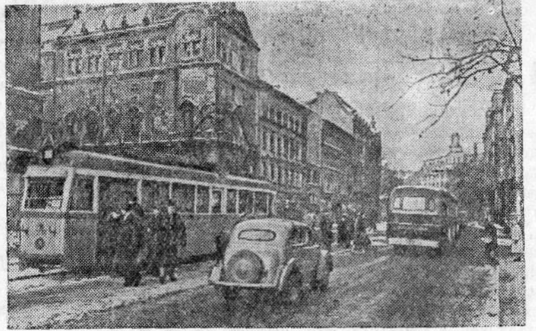
На улице Кошута.