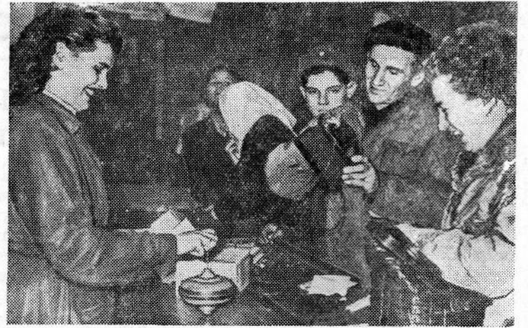
ВЕНГЕРСКАЯ НАРОДНАЯ РЕСПУБЛИКА. Нормальной жизнью снова живет город металлургов — Дунапентеле. Работают заводы, возобновились занятия в школах, открыты магазины.

На снимке: в промтоварном магазине. Покупатели приобретают игрушки.