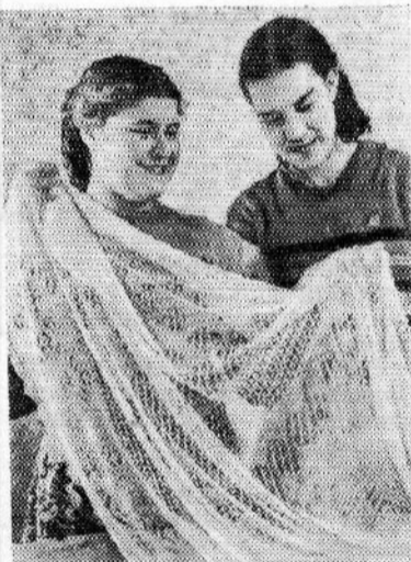
ЧКАЛОВСКАЯ ОБЛАСТЬ. Юноши и девушки готовятся к Всемирному фестивалю молодежи. В клубах и домах культуры проводятся фестивальные вечера. В городе Чкалове открыты городской комсомольский и три районных фестивальных клуба.

ный металлург завода тов. Багин, факты, указанные в письме, имели место. В настоящее время запроектирована и находится в изготовлении вытяжная вентиляция для участка. Намечено также строительство там